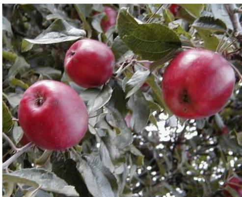
Dospělý jedinec a plod jabloně domácí 'Panenské české'

Výsadby budou umístěny rovnoměrně na navrženém úseku a dle umístění v zákresu ve výsadbovém plánu (viz přílohy), spon v souvislých výsadbových úsecích u ovocných stromů činí 8 m. Před provedením výsadeb bude